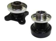
コンパニオンフランジ Flanges